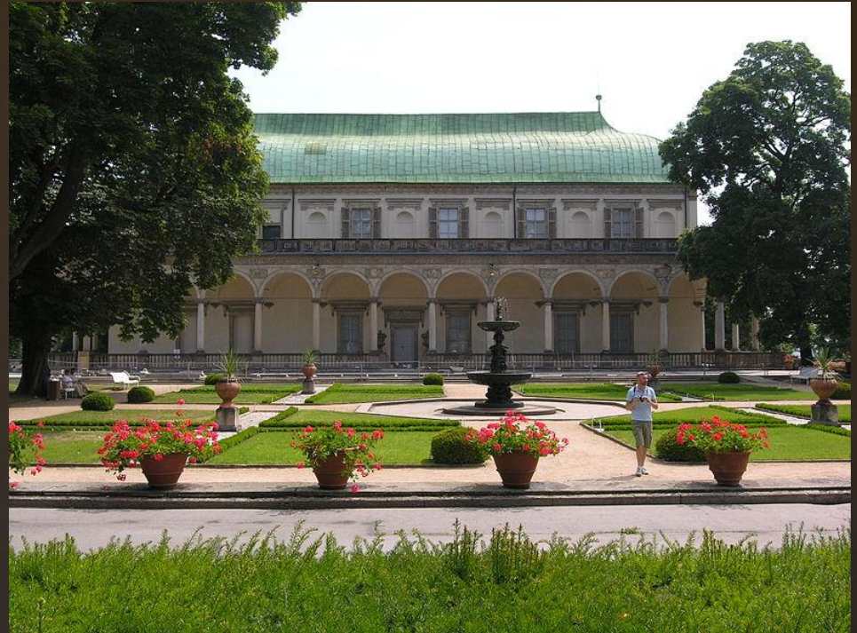
Letohrádek královny Anny (Belveder)