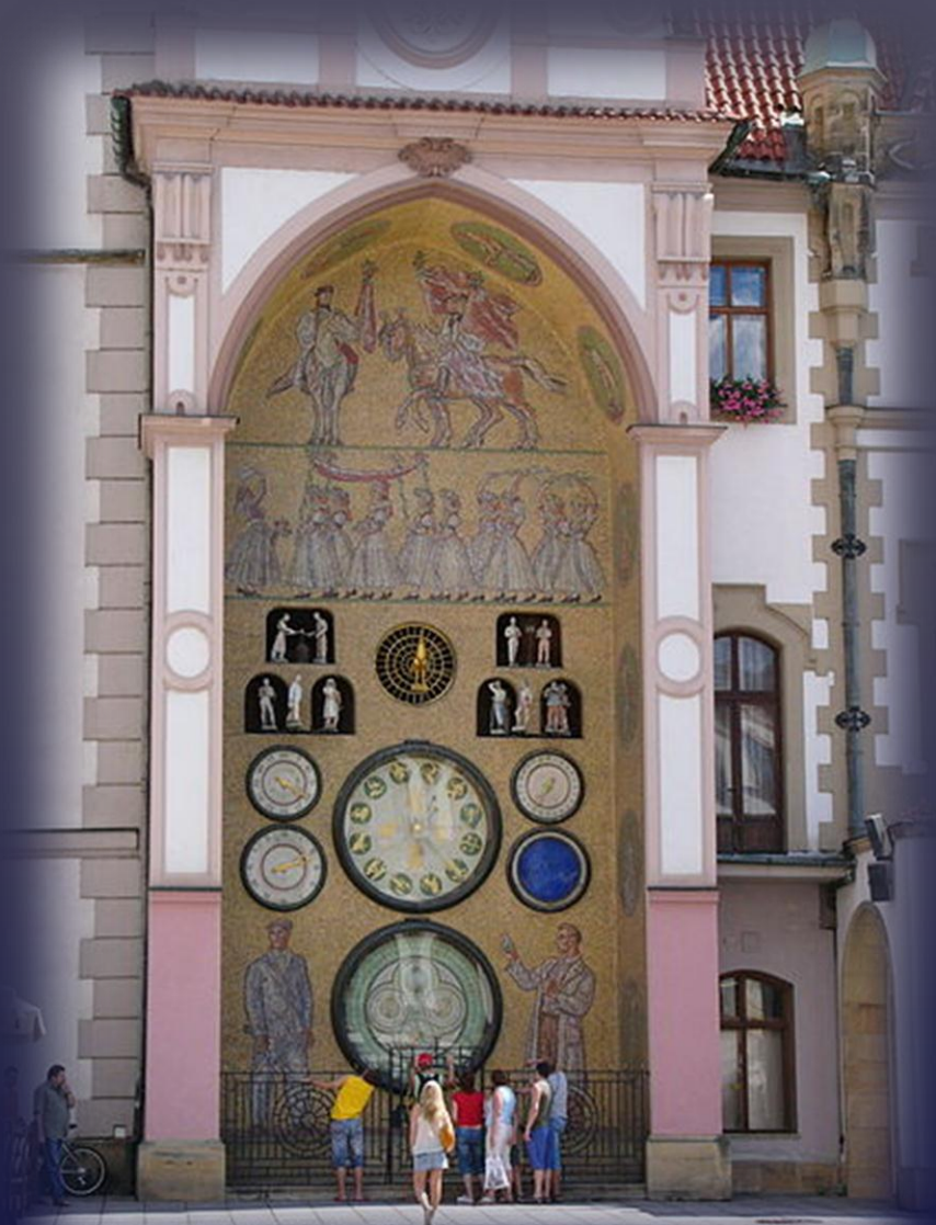
radnice s orlojem