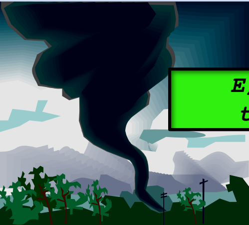
E) The town/hit/by a tornado/ last week.