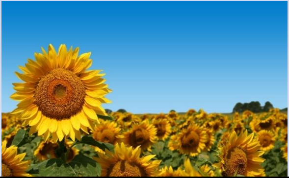
F) The sunflowers/planted/six months ago.