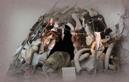
CHATRČE [Obr. 7]