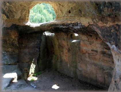
JESKYNĚ [Obr. 6]