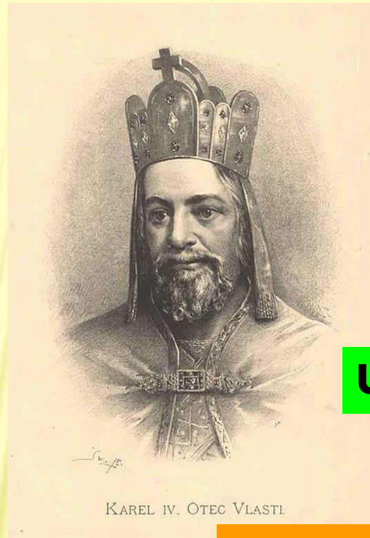
KAREL IV. OTEC VLASTI.